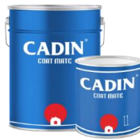
Bộ/5Kg (4Kg A và 1Kg B)