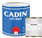
Bộ/1Kg (0.8Kg A và 0.2Kg B)

Sản phẩm được đóng gói trong lon/thùng sắt: