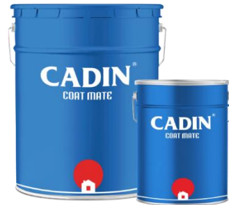
Bộ/20Kg (16Kg A và 4Kg B)

Tồn trữ nơi mát mẻ khô ráo. Tránh nguồn nhiệt và lửa.